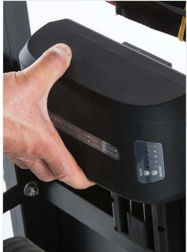
■ Herausnehmbare und wiederaufladbare 13 Ah-24V Lithium-Batterie