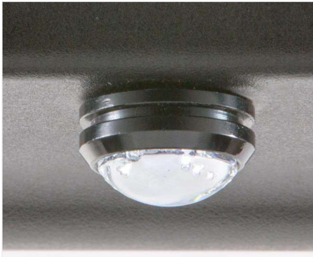
■ Innenbeleuchtung unter dem Bedienfeld